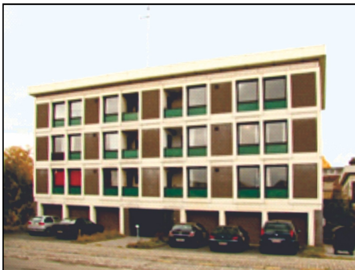
Terugkeerwoning in Tubeke

Hopelijk heb ik hen goed geïnformeerd, maar hun vooral ruimte gegeven om zich uit te drukken en om zich erkend te voelen. Zoals aan die Rwandese vrouw die me eens zei: “Ik ben nu al maanden in België en dit is de eerste keer dat er iemand naar mij luistert” .